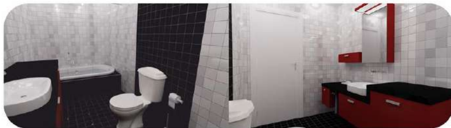
Haqal ottiziniq ker zoy barada